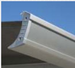
TM800 Etuprofiili, hopea