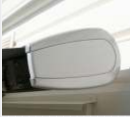
TM800 Kotelon sivu, hopea