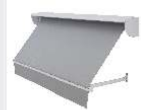
IM500 katosprofiililla (lisävaruste)

Ikkunamarkiisien sivuvarret ovat kestäväää alumiiniprofiilia. Tuuliluokitus 2-3 (DIN EN 13561) Markiisiosat ovat pulveripolttoaalattuja ja saatavana vakiona valkoisena, hopeisena tai mustana. Lisäksi tehdasväreinä löytyy 10 lisäväriä. Tilauksesta osat ovat maalattavissa myös kaikkiin muihin RAL-sävyihin.